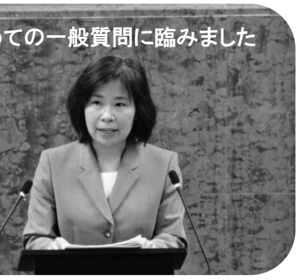
初めての一般質問に臨みました

★2017年には、市制100周年記念行事として、都市緑化フェアの開催が決まっております。当施設もサテライト会場の一つにあがっています。本物の緑と共生した暮らしを日々送っている私たち八王子市民がやるのであれば、「100年先の環境を考えるフェア」として、多くの市民参加で開催するべきです。